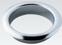
リング (オプション) Ring(option)