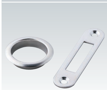
リング、受け板 (オプション) Ring, Pad (option)

※写真および仕様図は標準仕様のものです。 Photo and Diagram indicate the standard model.